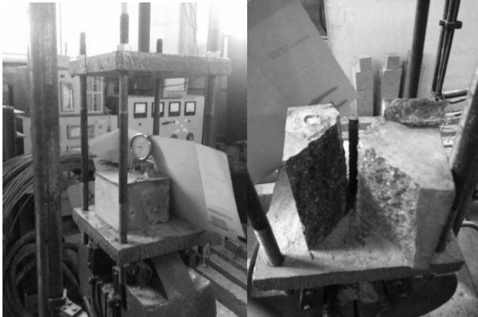
Рис. 2. Загальний вигляд випробування зразків у силевій установці та вигляд зразка після руйнування

Для проведення випробувань було забетоновано дві серії зразків. Перша серія виготовлялася з бетону класу С25, а друга С70. Для кожної серії було виготовлено по 6 зразків з розмірами 100×100×100 мм. Арматура використовувалася діаметром 10 мм класу А500С, що в комплексі з розміром зразків з бетону забезпечило довжину анкерування 10 d . Також для кожної серії виготовлялися кубики розміром 100×100×100 мм в кількості 6 штук для