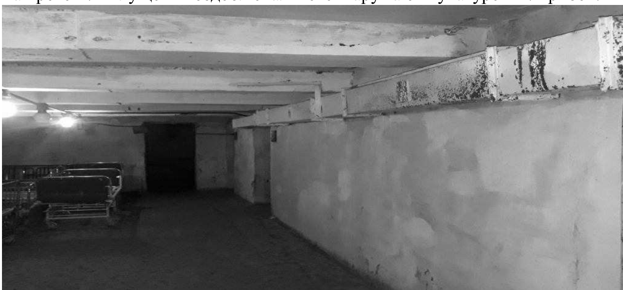
Рис. 3. Фотофіксація №10. Сирість у приміщенні, замокання, грибок. Корозія повітропроводу системи вентиляції.