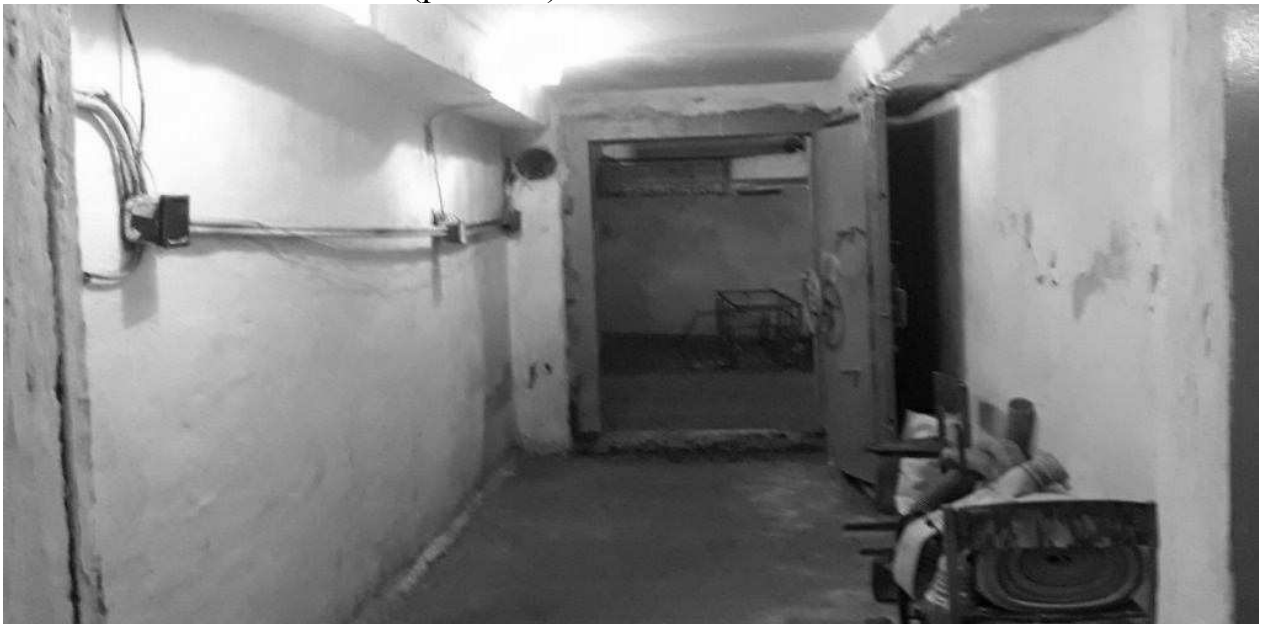
Рис. 1. Фотофіксація №2. Вхід у сховище. Виколи та вилущення бетону на прогоні. Вилущення оздоблювального шару та оштукатурення. Грибок.

Нижче наведемо декілька фото характерних дефектів та пошкоджень обстеженого бомбосховища (рис. 1-5).