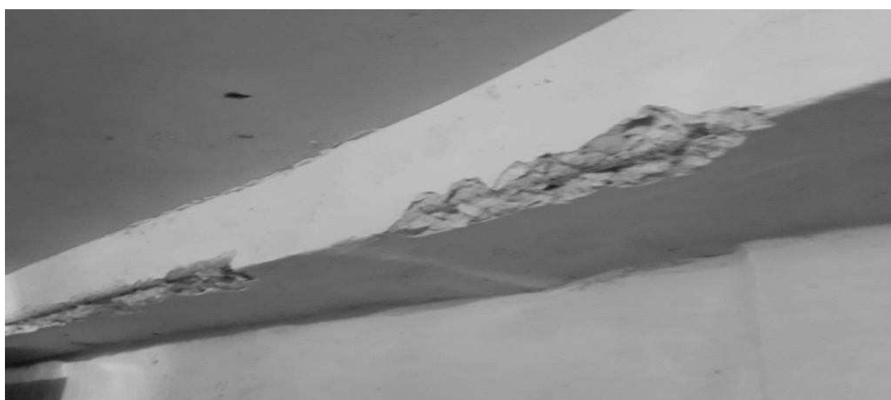
Рис. 2. Фотофіксації №3,4. Вхід у сховище. Виколи та вилущення бетону на прогоні. Вилущення оздоблювального шару та оштукатурення. Грибок.