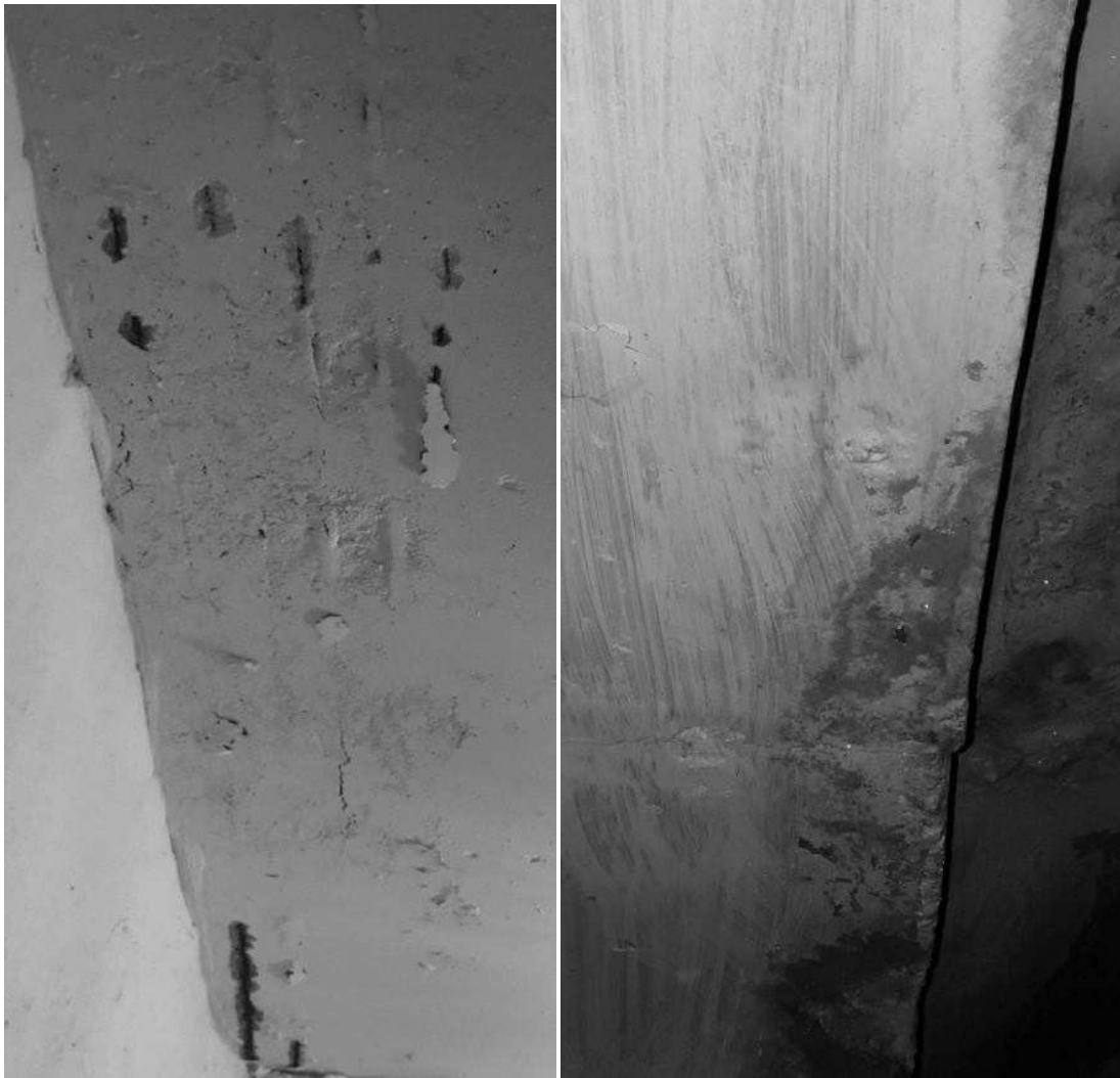
Рис.4. Фотофіксації № 6, 22. Корозія арматури плити перекриття.Замокання, грибок на прогоні та плиті перекриття.