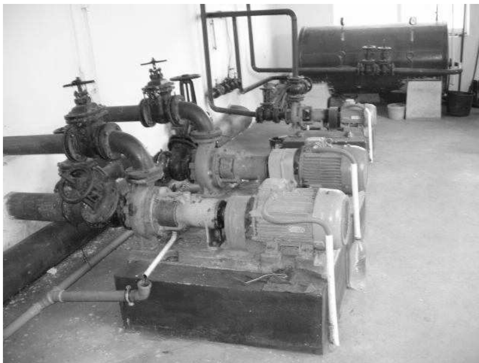
Рис. 3. Розміщення обладнання у виробничо-допоміжній будівлі очисних споруд ДП «М'ясопереробний комплекс «Росана»»

області, м'ясопереробного цеху у с. Велика Димерка Київської області, «Тарасовецької птахофабрики» Чернівецької області, ДП «Ружин-молоко» та деяких інших.