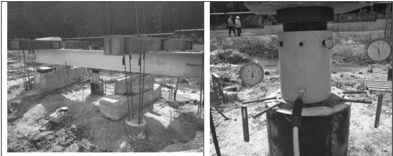
Рис. 2. Загальний вигляд випробувальної установки та вимірювальних приладів

прикладалось ступенями, згідно програми випробовувань, але не більше 1/10 заданого найбільшого навантаження на палю.