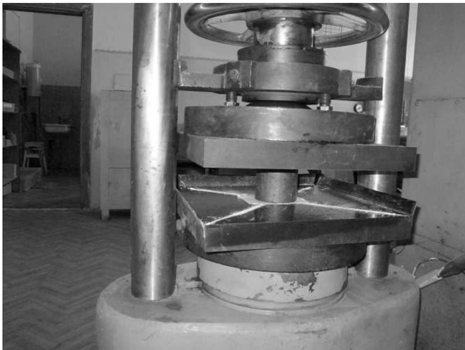
Рис. 2. Випробування зразка на гідравлічному пресі

Найбільший показ силовимірювача приймається за руйнівне навантаження.