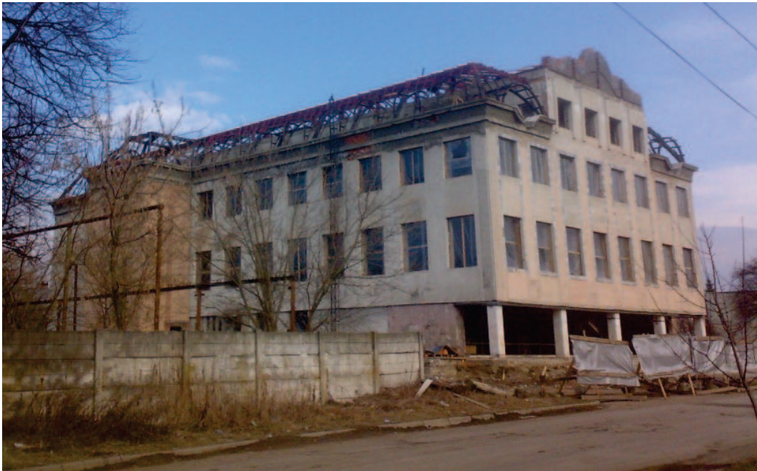
Рис.1. Загальний вигляд їдальні фабрики «Зеніт»

Загальний вигляд в період капітального ремонту (04.03.2009р.) показано на рис.1.